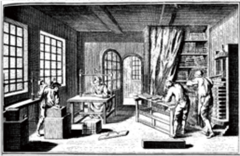
フランス百科全書 図版集

日時 2019年5月25日(土) ①回目 10:30～12:30 ②回目 14:00～16:00 定員 各回10名(要予約) 参加費 各回3,000円(材料費込み) 持ち物 カッター・目打ち・へら(裁縫用可)・スティック糊 場所 大阪府立中之島図書館 本館2階レンタルスペース1