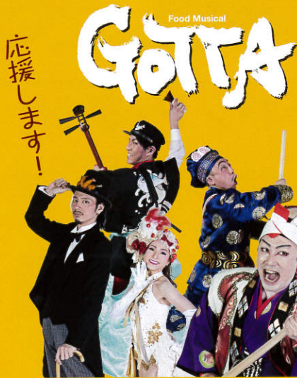
道頓堀発の新感覚エンターテインメント フードミュージカルGotta