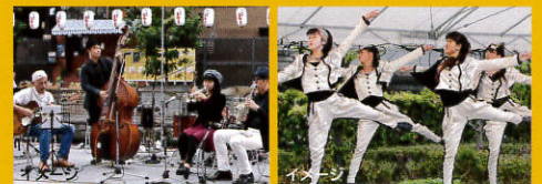
※ステージ時間はHPにてご確認ください。

■お問い合わせ: 産経新聞開発株式会社 道頓堀リバーフェスティバル事務局 06-6633-6834(平日10:00~17:00)