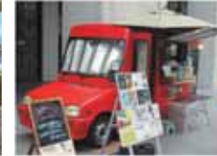
ルリアンcafé *珈琲、焼き菓子、スムージー