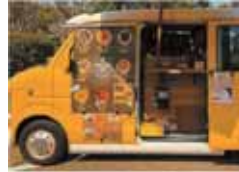
旅する象 *クレープ