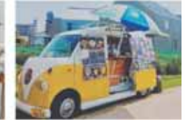
crepe jummy *クレープ