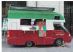
石窯PIZZA「ANTHONY」 *石窯ピッツァ・ジュレット