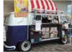
ナマステイ *ナン専門店