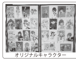
オリジナルキャラクター

2022年度プログラムの実施風景や制作作品を紹介する展示会を開催します。みんなの作品を鑑賞してみよう!