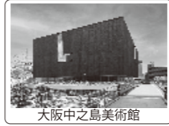
大阪中之島美術館