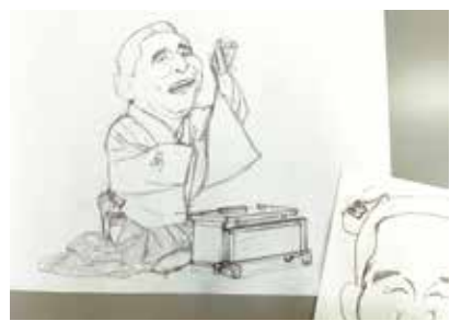
【初公開】イラストの下絵

主催 大阪府立上方演芸資料館 (ワッハ上方) 協力 在阪放送局ワッハ上方プロモーション委員会 (MBS・ABC・KTV・YTV・TVO・OBC)