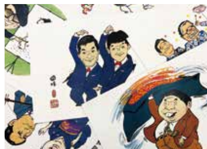
殿堂入り名人の活躍を描いたイラスト