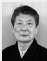
友枝 昭世 ともえだ あきよ

華道家元池坊 次期家元。紫雲山頂法寺(六角堂)副住職。 いけばなの「いのちを生かす」という哲学に基づき、作品の出瓶や他分野とのコラボレーションなどを行う。2018年、横浜能楽堂「能の花能を彩る花」において、観世流・大槻文藏氏と演目『東北』で共演。公益社団法人2025年日本国際博覧会協会(2025年大阪・関西万博)理事・シニアアドバイザー。