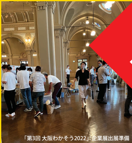
「第3回 大阪わかそう2022」:企業展出展準備