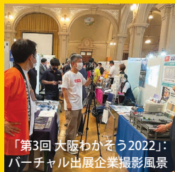
「第3回 大阪わかそう2022」: バーチャル出展企業撮影風景