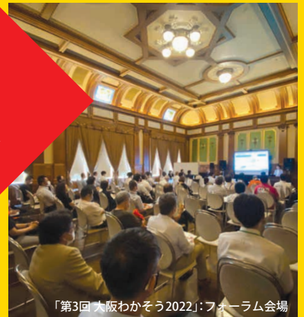
「第3回 大阪わかそう2022」:フォーラム会場