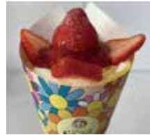
【フランス】クレープ