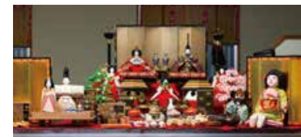
別所家のおひなさま