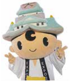
「ゆめまるくん」もやってくる

船場博覧会場内に設置したスタンプラリースポットでスタンプを集めていただいた方に 2025大阪・関西万博500日前記念中央区オリジナル缶バッジをプレゼントします。