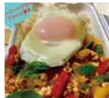
【タイ】カバオライス