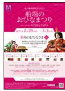
春の船場博覧会2023 「船場のおひなまつり」ポスター