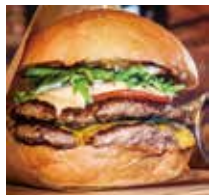
【アメリカ】ハンバーガー

誰もが楽しめる世界のメニュー。 お昼休みに、休日に楽しんでいただけのランチ&ディナー!