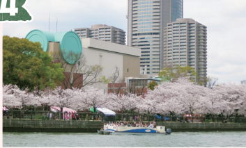
造幣局 (ぞうへいきょく)

1871年4月に創業した、日本の硬貨を作る場所です。特徴は、建物外観にある緑の丸。これは硬貨をイメージしたものと言われています。