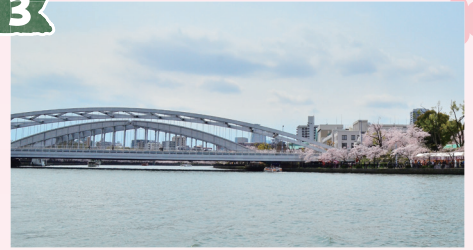
桜宮橋 (さくらのみやぼし)

大阪市民からは「銀橋」の愛称で親しまれている橋。この橋が架けられてから80年以上の歳月が経っており、橋の寿命から考えるととても長生きしている橋といえます。