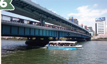
天満橋 (てんまぼし)

大阪のまちにとって重要で、親しみのある橋「浪花三大橋」の一つ。渋滞緩和の為に、2階建ての構造になっており、大阪では珍しい形の橋です。