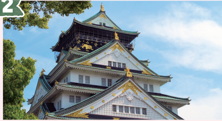
大阪城 (おおさかじょう)

大阪のシンボル、大阪城。クルーズ中にも何度か見ることができ、ビルの後ろから出てきたり隠れたりする姿はとても愛らしく感じます。また、八軒家浜船着場から大阪城天守閣までは歩いて30分程かかりますが、乗船後に春を感じながらのお散歩はいかがですか。