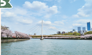
川崎橋 (かわさきぼし)

人と自転車のみが通行できる斜張橋。斜張橋とは塔から斜めに張ったケーブルで支えている橋のことです。