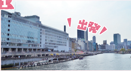
八軒家浜船着場 (はちけんやはまふなつきば)

「大川さくらクルーズ」の発着場所である八軒家浜船着場は、かつては京都・伏見と大坂を結ぶ舟運の拠点となる場所でした。周辺に八軒の船宿があったことから「八軒家浜」と呼ばれるようになりました。