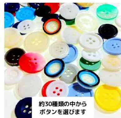
約30種類の中から ボタンを選びます