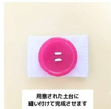
用意された土台に 縫い付けて完成させます