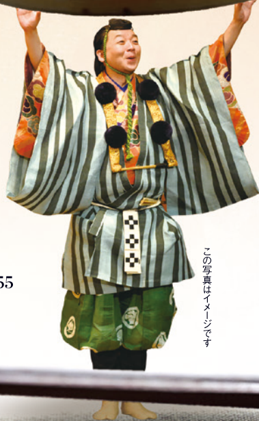
この写真はイメージです