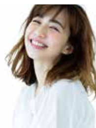
万博トークショーに オンラインで出演