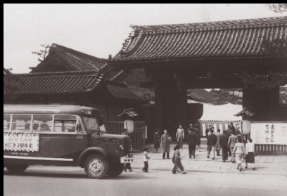
東本願寺で行われた会の様子(昭和25年)。皆様「江戸の粋」や「京の雅」が表現された品々を心ゆくまで楽しまれたようです。

「東西名匠老舗の会」は昭和二十五年、京都の名刹 東本願寺にて始まりました。東の「東京むらさき会」、西の「京都くれない会」の数々の老舗で結成され、自慢の品々を披露。その腕を競い合いました。