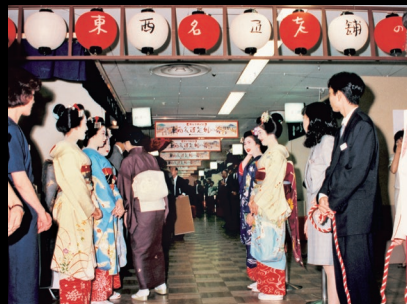
第50回記念(平成4年)にて。舞妓さんがお客様をお出迎えし、粗品をお渡しました。

その後、当時としては珍しいこの会をより多くの人に見ていただこうと、東は日本橋高島屋、西は大阪高島屋で開催する運びとなりました。